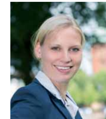
Bürgermeisterin Dorothe Klömmer